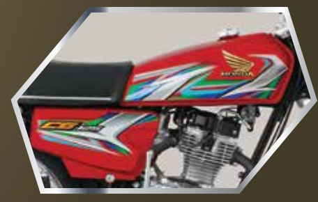
نیو ڈیزائن فیول ٹیک اور سائیڈ کور گر فکس euro2 سٹیپر کے ساتھ