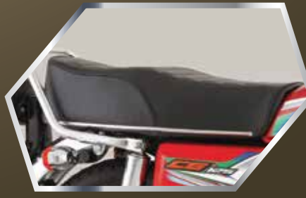
نیو ڈیزائن آرا مدہ سیٹ بیج سیٹ بار