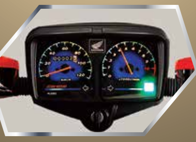
اسٹائنلس ڈیزائن اسپیدومیٹر