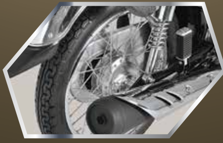
مضبوط اور پائیدار ریئر ڈیویس