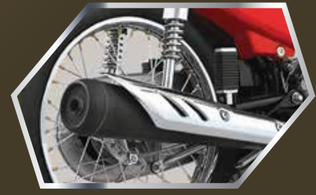
جدید ہائی پینٹ سائیکلینس اسٹائنلس کور کے ساتھ اور وہی دکھش آواز