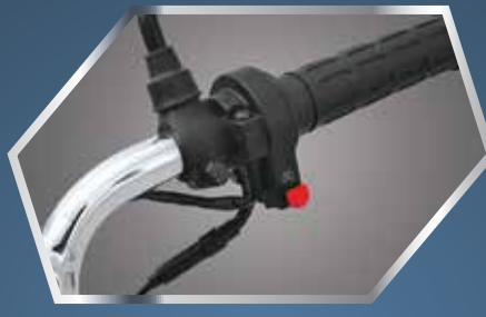
سیلف اسٹارٹ سٹم