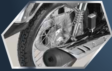
مضبوط اور پائیدار ریبر ڈھیل