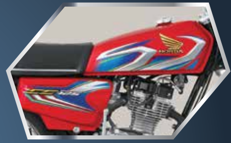
نیو ڈیزائن فیول ٹیک اور سائیز کو گرافکس euro 2 اسٹیپر کے ساتھ