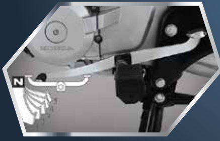
5 گئیر ٹرانسمیشن