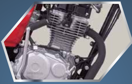
جاپانی ٹیکنالوجی کا شاہکار OHV انجن بائی ٹیک پائلس اور euro 2 ٹیکنالوجی کے ساتھ