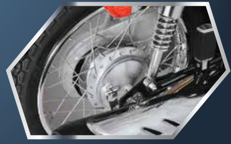
بڑا پچھلا بریک ڈرم دے زبردست کنٹرول