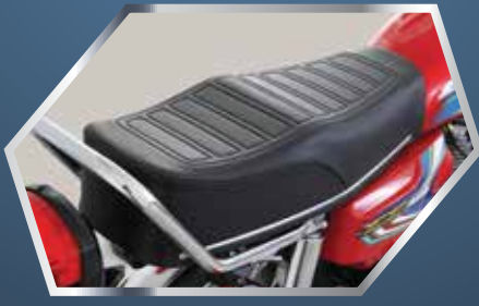
نیو ڈیزائن آرام دہ سیٹ مع سیٹ بار