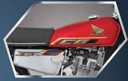
نیو ڈیزائن لکش گرافکس مع منفرد کروم سائیز کوور