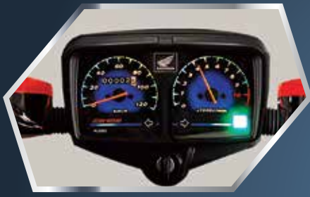
اسٹائنلس ڈیزائن اسپیدومیٹر