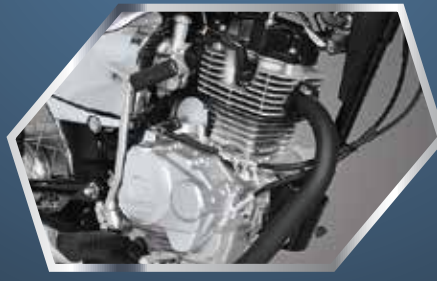
جاپانی ڈیکالوجی کا شاہکار OHV انجن بائی ٹیک پارٹس اور euro 2 ڈیکالوجی کے ساتھ