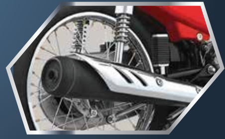
جدید بائیک پیٹنٹس ایلیمنس اسٹائنلس کور کے ساتھ اور وہی رکتش آواز